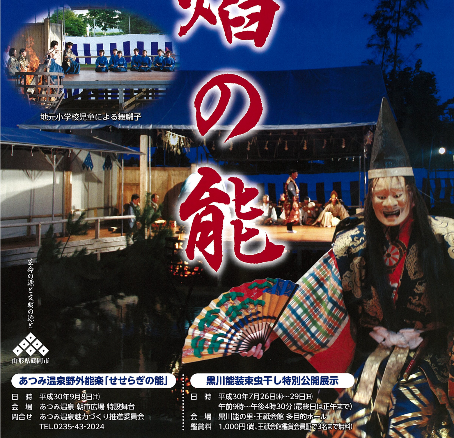
地元小学校児童による舞囃子