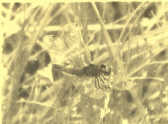
ハッチョウトンボ(み)