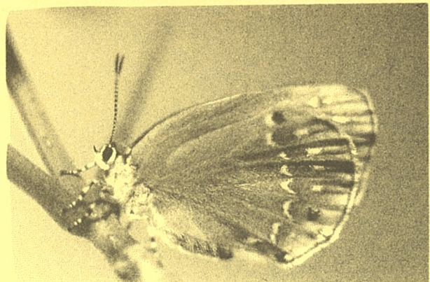
チョウセンアカシジミ