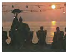
山戸能【県指定無形民俗文化財】

山五十川地区には、能と歌舞伎の二つの民俗芸能が伝わっており、一つの集落で二つの無形民俗文化財を一体として守り続けている例は全国でも大変珍しいといわれています。山戸能、山五十川歌舞伎ともに、五穀豊穡や安全を願う祭礼の奉納として、また、庶民芸能として、地域に脈々と伝承されています。