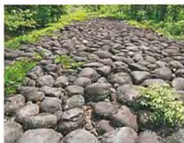
直江石堤【市指定史跡】

芳泉町の石垣・生垣の造成は、約400年前、直江兼続公の時代に遡ります。川除堤防(蛇堤)とともに、直江石堤決壊時に、米沢城下が大洪水に見舞われるのを未然に防ぐ役割を果たしてきました。