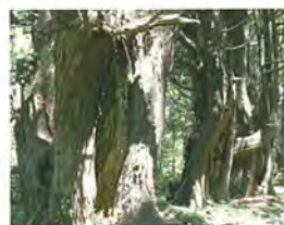
幻想の森(山の内杉)

戸沢村を流れる最上川中流部は最上峡と呼ばれ、両岸には樹齢1千年を超す天然木の「山の内杉」が群生し、左岸の土湯山の一角は「幻想の森」と呼ばれています。