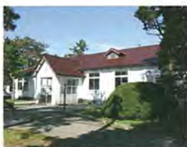
旧農省蚕糸試験場新庄支場 【国登録有形文化財】

昭和9年(1934)に誕生した蚕糸試験場新庄支場は、この地域の農業の発展に大きく寄与してきました。試験場の役割を終え、平成14年に新庄市エコロジーガーデン「原蚕の杜」として開園。人と農、歴史と文化、自然と景観が融合し、地域の歴史を伝えています。昭和初期からの建物群や桜、桑、ケヤキなど多くの木立が、風合い豊かな雰囲気を出しています。