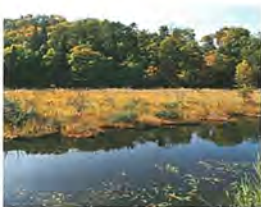
新田堤【市指定天然記念物】

置賜盆地の北東部に位置する「白竜湖」のある一帯は、約1000haにもおよぶ泥炭湿原であり、大谷地とよばれ、田んぼと湖のある独特の景観として多くの人々に親しまれてきました。現在の風景の中には食料増産を行った祖先の努力と苦労の歴史が刻み込まれています。