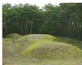
下小松古墳群【国指定史跡】

川西町下小松地域は、農村が点在する平坦部とその背景にグリーンベルトとして連なる丘陵部からなっています。このうち丘陵部は、長い間、薪炭林などとして人々の暮らしで利用されてきた典型的な里山で、4～6世紀には20基ほどの前方後円墳を含む約200基の下小松古墳群が築かれました。また、チョウセンアカンジミやヒメサユリなど希少な動植物の宝庫でもあり、米沢盆地の散居集落と背景の奥羽山脈を良好に臨むことができます。