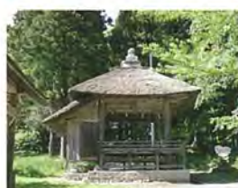
八幡神社舞楽殿 【県指定有形文化財】