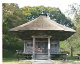
みらくち 水口十一面観音堂 【町指定有形文化財】

朝日町を流れる最上川に沿った地域は古くから「五百川郷」と呼ばれ、最上川が形成した河岸段丘上には、先史時代からの山・川の恵みに育まれた人々の生活、その後、湧水や河川からの導水により農業を興してきた歴史があります。また、五百川峡谷に沿った陸路、江戸時代以降の最上川舟運によって、米沢藩の物資などが遠く酒田まで運ばれていた歴史を背景に、数多くの歴史的文化遺産が存在しています。