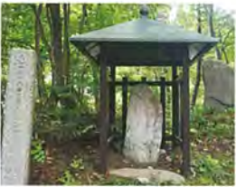
塩地平の草木塔 【市指定有形文化財】