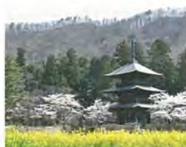
八幡神社三重塔【県指定有形文化財】

高畠町は、古より豊かな自然を基盤として多様な歴史と文化を育んできたところです。特に八幡神社を中心とする地域は、5件の県指定文化財をはじめ、「倭舞」や「田植舞」等の芸能、境内に点在する石造物、旧本殿跡や旧阿弥陀堂跡等の埋蔵文化財、神社を取り巻く八幡山の生態系等、幅広い時代にそれぞれの文化が開いた数多くの歴史文化遺産に恵まれた地域です。