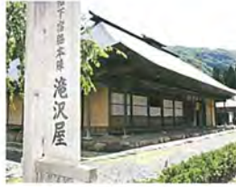
旧丹野家住宅 【県指定有形文化財】

羽州街道榎下宿は、江戸時代に東北13藩が参勤交代の折に立ち寄った宿場で、往時の町並みが大切に保存されています。古文書によると、出羽三山詣での行者、各藩の家中や商人などが宿泊した記録が残っており、非常に栄えた宿場であったことがうかがえます。