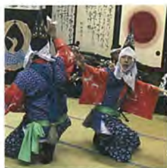
平枝番楽【町指定無形民俗文化財】

真室川町には昔から修験者の山岳修行の地として知られている加無山系の男甑山・女甑山があり、修験道に由来する地名や修験者まつわる伝説が今も残されています。また、地内を通る旧矢島街道を伝わってきたと考えられる「番楽」が伝承されており、加無山系を中心とした山岳信仰をテーマに深い結び付きがある地域です。