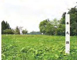
清水城跡【県指定史跡】