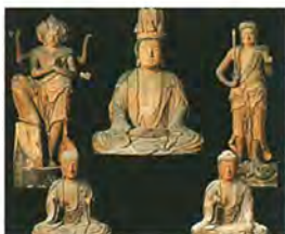
木造弥勒菩薩及諸尊像 【国指定重要文化財】