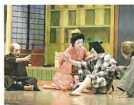
山五十川歌舞伎 【県指定無形民俗文化財】