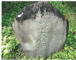
白夫平の草木塔 【市指定有形文化財】

草木塔は、「草木塔」「草木供養塔」という碑文が刻まれている塔であり、ほとんどが採石された状態のままの自然石です。