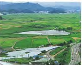
白竜湖泥炭形成植物群落 【県指定天然記念物】