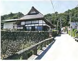
羽州街道 榎下宿 金山越 【国指定史跡】