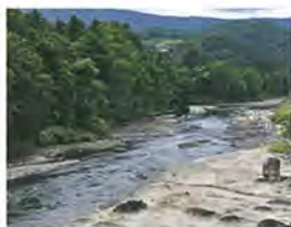
岩盤群とつぶて石