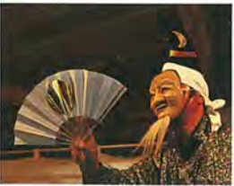
杉沢比山 【国指定重要無形民俗文化財】