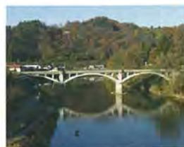
最上川と旧最上橋、楯山

最上川舟運の河岸として発展してきた左沢には、最上川などの自然環境と、左沢楯山城跡や小漆川城跡が物語る政治的拠点としての歴史があり、舟運や農山村との流通・往来に根ざした生活・生業が有機的に結びついて、複合的・重層的な文化的景観が形成されています。平成25年3月27日、県内初の重要文化的景観として選定されました。