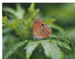
チョウセンアカンジミ 【県指定天然記念物】