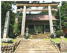
鳥海山大物忌神社蕨岡口ノ宮隨身門 【国登録有形文化財】

蕨岡地区は神宿る山、鳥海山の山麓に位置し古来より山岳信仰が発展してきた地区です。鳥海山信仰とつながりを持つ多くの文化財や地域行事が保存・伝承され、上寺集落にはかつての鳥海山修験にかかる宿坊の景観が今も残っています。