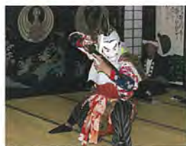
はっしきだい 八敷代番楽 【町指定無形民俗文化財】