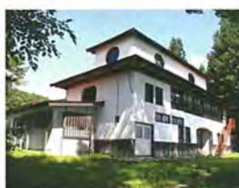
旧西五百川小学校三分校 【県指定有形文化財】