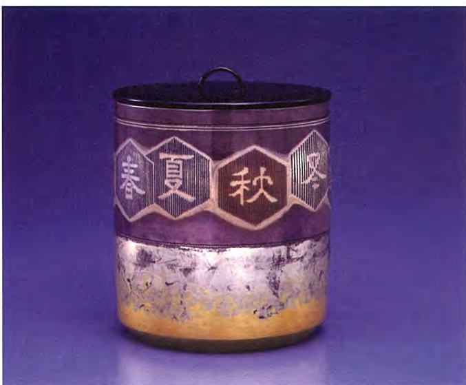
写真右…天牛金具 左…四季文銀水指

問合せ 東北芸術工科大学 美術科工芸準備室 山形県山形市上桜田 3-4-5 TEL:023-627-2112 e-mail soutome.haruka@aga.tuad.ac.jp 工芸コース公式 Facebook www.facebook.com/tuad.kougei